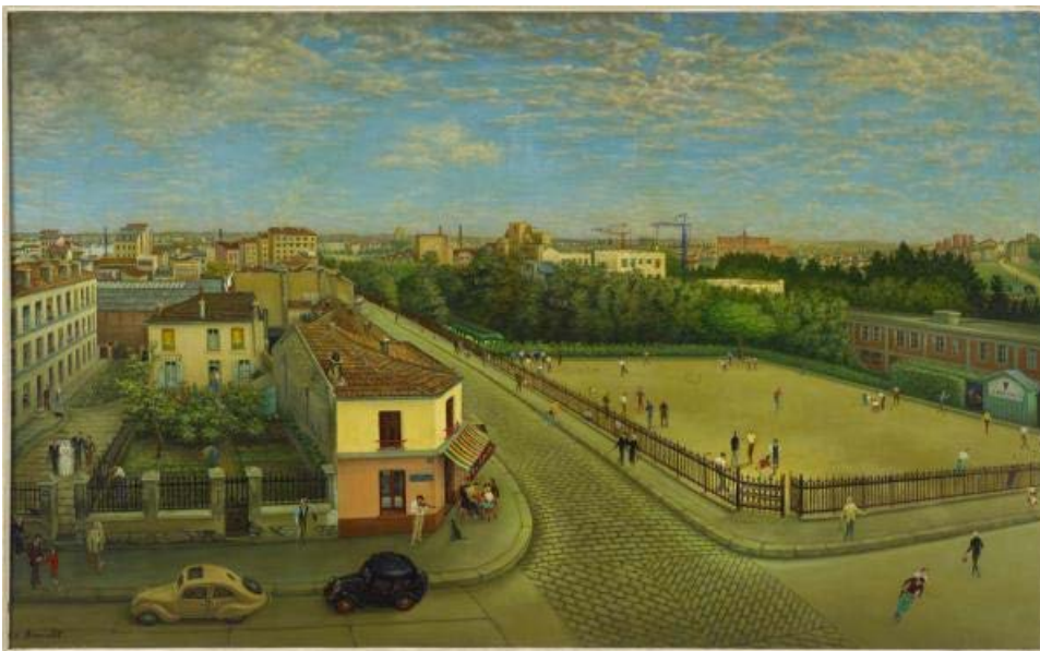
Πιέρ Αρκαμπό (Pierre Arcambot), «Η θέα από το παράθυρό μου, η διασταύρωση των οδών Ρενό (Régnauld) και Σιατό-ντε-Ρεντιερ (Château-des-Rentiers)», 1955, λάδι σε καμβά