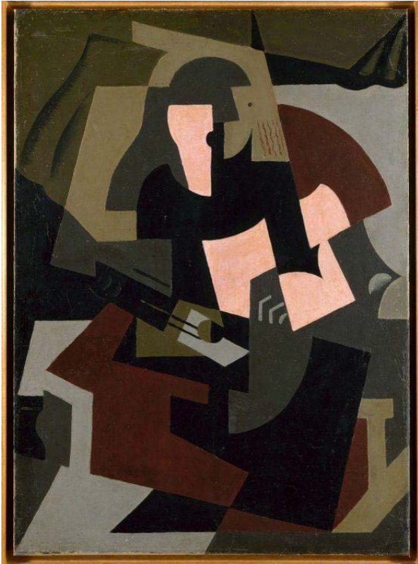
Μαρία Μπλάντσαρντ (Maria Blanchard), «Γυναίκα με κιθάρα», 1917, λάδι σε καμβά