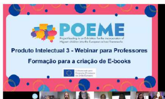
Image du webinar organisé par SPEL