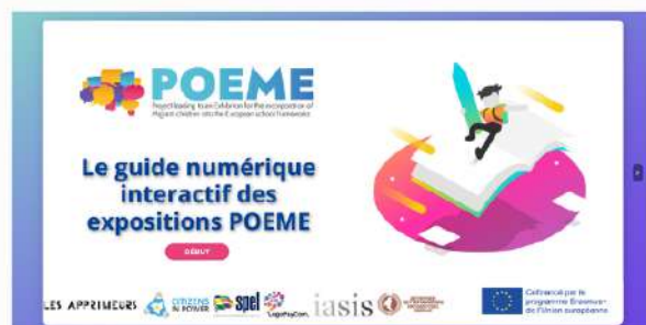
Guide numérique interactif

Ce guide numérique sera une ressource importante pour les professionnels de l'éducation qui cherchent à créer des expositions mixtes attrayantes et efficaces pour leurs élèves.