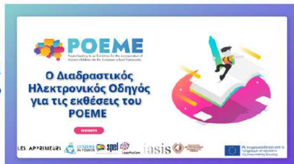
Ο Διαδραστικός Ηλεκτρονικός Οδηγός του ΡΟΕΜΕ

Αυτός ο Ηλεκτρονικός Οδηγός αποτελεί σημαντική πηγή για τους εκπαιδευτικούς που επιθυμούν να δημιουργήσουν ελκυστικές και αποτελεσματικές μικτές εκθέσεις για τους μαθητές τους.