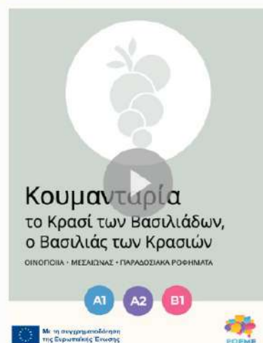
Εξώφυλλο ενός από τα ηλεκτρονικά βιβλία του ΡΟΕΜΕ

Κάθε εταίρος ανέπτυξε δύο ηλεκτρονικά βιβλία που επικεντρώθηκαν σε ένα στοιχείο της πολιτιστικής κληρονομιάς από τις συμμετέχουσες χώρες στο έργο. Τα ηλεκτρονικά βιβλία αποτελούν εξέλιξη των ηλεκτρονικών φύλλων εργασίας που δημιουργήθηκαν στο πλαίσιο του έργου και που στοχεύουν στην εκμάθηση μιας δεύτερης γλώσσας. Τα ηλεκτρονικά βιβλία είναι διαδραστικά και περιλαμβάνουν επιγλωττίσεις και γλωσσάριο με τους ορισμούς δύσκολων λέξεων που εμφανίζονται στις ιστορίες. Κάθε βιβλίο διατίθεται σε τρία επίπεδα γλωσσομάθειας (A1, A2 και B1) και έχει μεταφραστεί στα γαλλικά, πορτογαλικά και ελληνικά.